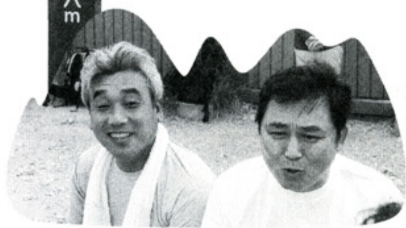
=薬師岳にて= 7月22日-23日